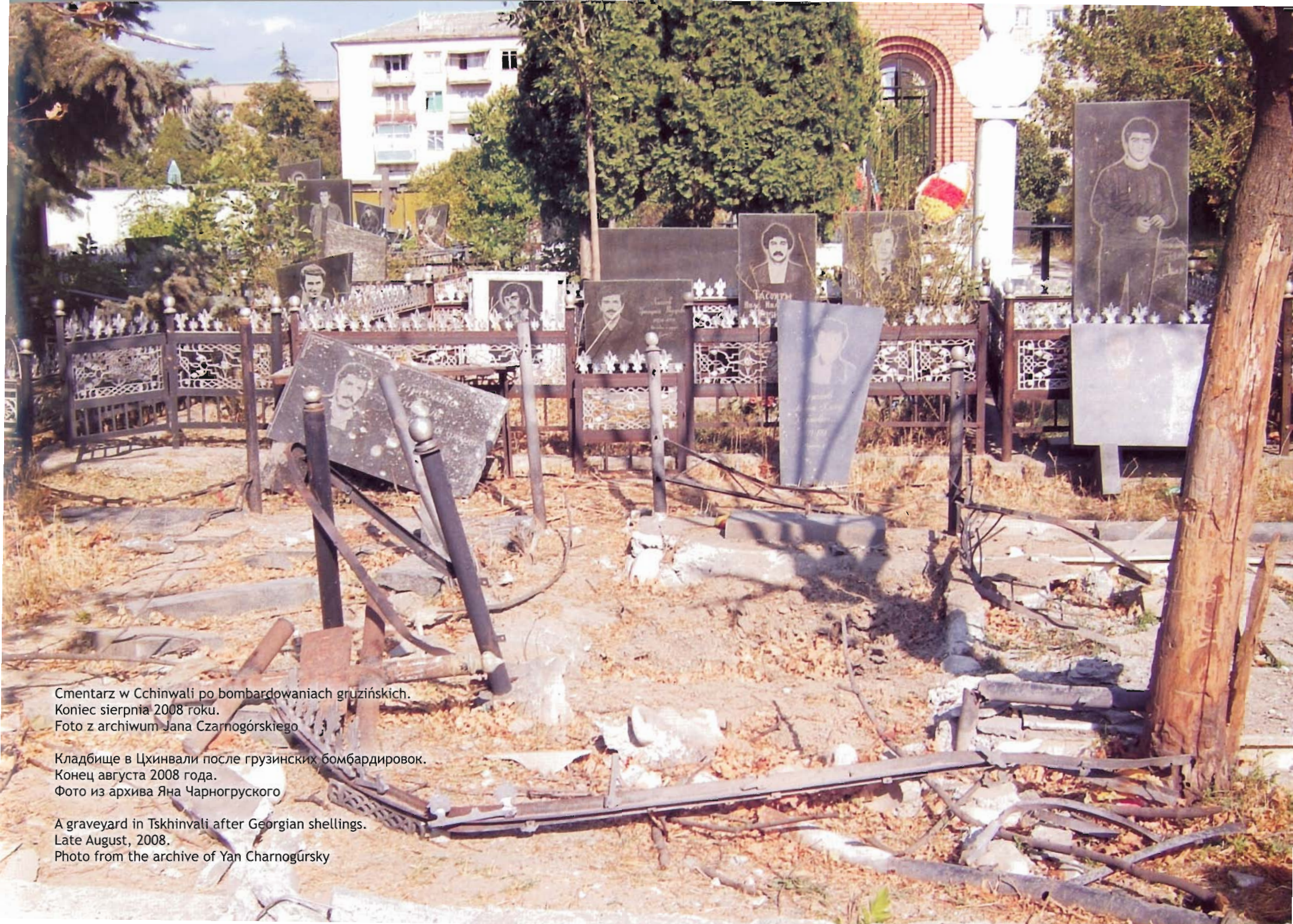
Cmentarz w Cchinwali po bombardowaniach gruzińskich. Koniec sierpnia 2008 roku.