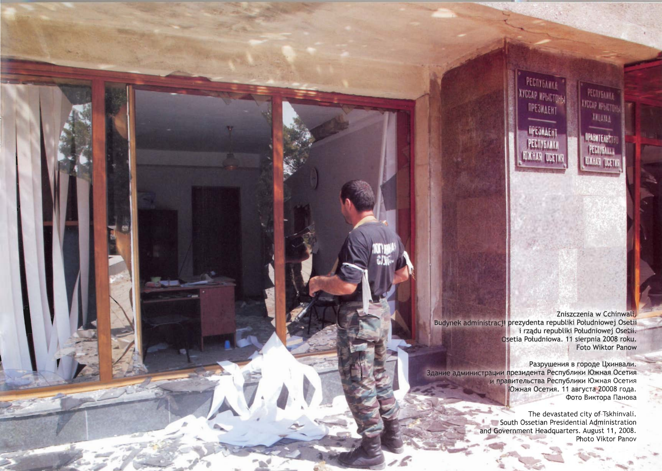
Zniszczenia w Cchinwali. Budynek administracji prezydenta republiki Południowej Osetii i rządu republiki Południowej Osetii. Osetia Południowa. 11 sierpnia 2008 roku.