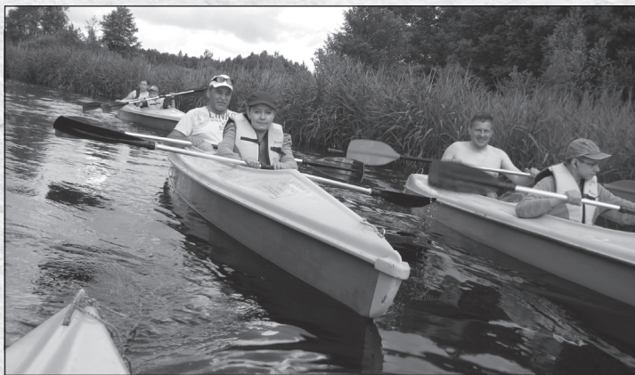
Сплав по Августовскому каналу во время ежегодного летнего лагеря

Грондах построены современные приходские дома, отремонтирована моленна в Войнове-на-Мазурах, изданы два учебника. Оживилась религиозная жизнь, на старообрядческом наречии преподается Закон Божий. С появлением Фонда и Главного совета авторитет старообрядцев в Польше растет. Этому способствует и деятельность Общества старообрядцев.