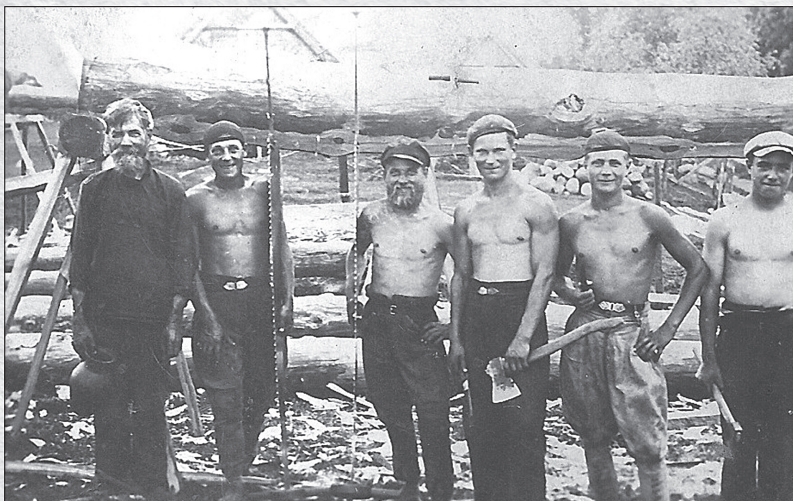
Главное занятие староверов в прошлом – деревообработка

Старообрядцы в Польше сумели сохранить свое религиозное и культурное своеобразие. В семьях и между собой староверы разговаривают только