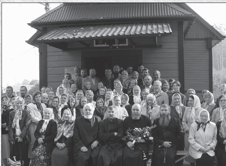
Жители деревень Габовые Гронды и Бор, 2009

В 1921 году в Августовском регионе проживали 932 старообрядца. Се-годняшние жители Габовых Грондов и Бора считают, что первые поселе-нцы прибыли сюда из деревни Пильчин сразу после подавления восстания 1863–1864 годов. Возможно, уже раньше они временно проживали в Августовском уезде или на Сувалкско-Сейненской земле. Другие утверж-дают, что их предки жили в окрестностях Осташкова, на Тверской земле. Иные говорят, что их предки проделали длинный путь из северных районов России через Белое море, Скандинавский полуостров и Балтийское море. Последней и самой молодой деревней старообрядцев стали Габовые Гронды. Потом рядом с ней возникла деревня Бор. Главным занятием ста-рообрядцев были работы, связанные с лесным хозяйством. Популярной была профессия пильщика. Очень быстро старообрядцы стали признан-ными мастерами деревообработки, известными своей добросовестнос-тью далеко за границами региона. Женщины ткали и, главным образом, изготавливали ткани изо льна. Часто изделия, произведенные в дере-внях Габовые Гронды и Бор, можно было встретить не только на рынке в Августове, но и в других польских городках. Во время Первой мировой войны большинство старообрядцев Августовского региона эвакуирова-лись в глубь России, в окрестности Саратова. Впоследствии вернувшиеся