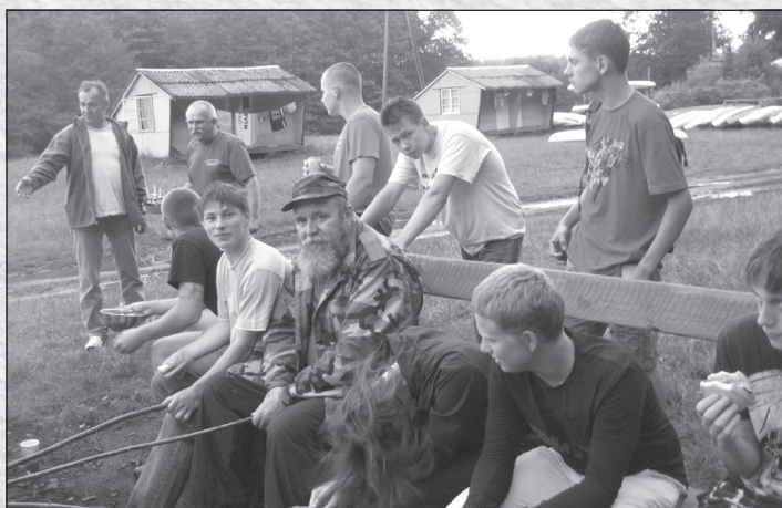
Во время молодежного лагеря