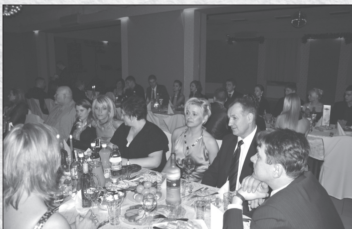
Ежегодный бал соотечественников, 2009