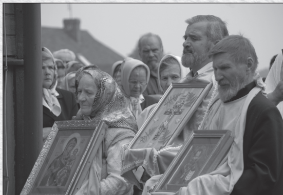
Крестный ход, 2008