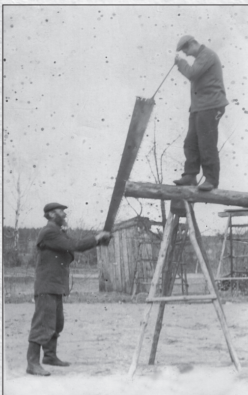
Пильщики на работе, 30-е годы XX в.

из эвакуации в ставшие родными места старове- ры стали усердно восстанавливать практически полностью разрушенные селения. В 1921 году в Боре жили 144 старообрядца, а в Габовых Грон- дах – 216. Всего же в границах Польши тогда проживали около 100 тысяч староверов.