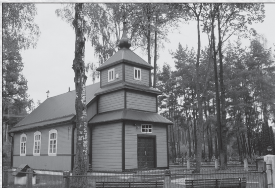
Моленна в Габовых Грондах, 2009

В последние годы существенно улучшилось юридическое и материальное положение старообрядчества. На это повлияла и деятельность Главного совета, в который вошли молодые и образованные люди, а также создание Фонда имени семьи Пимоновых, учрежденного профессором Леонидом Пимоновым из Франции. Благодаря этому в Сувалках и Габовых