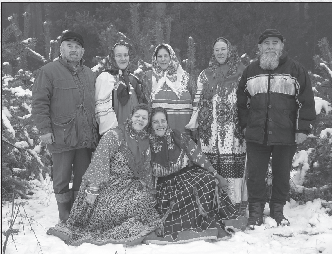
Фольклорный ансамбль «Рябина»

Сегодня старообрядцы в Польше по праву гордятся и уникальным фольклорным ансамблем «Рябина», который в 2008 году выступал в Москве. Это женский хор, поющий без сопровождения музыкальных инструментов и исполняющий старинные русские свадебные песни, баллады и песни хороводные. Некоторые из них звучат также и на новгородско-псковском диалекте. На сцену артистки выходят в самостоятельно сшитых традиционных народных костюмах. Ансамбль «Рябина» выпустил три диска – «Песни староверов» (2000), «Белые голуби» (2004), «В староверской деревне» (2008). Все участницы хора – уроженки деревень Габовые Гронды и Бор.