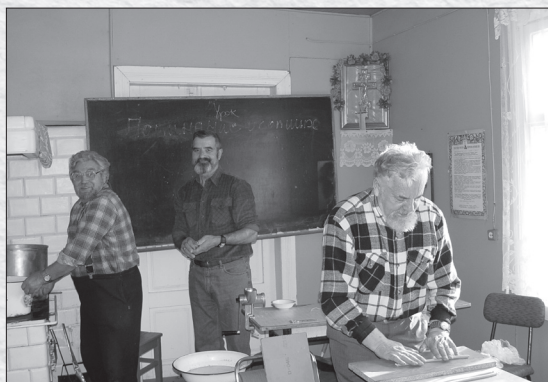
Ручное изготовление свечей, 2009