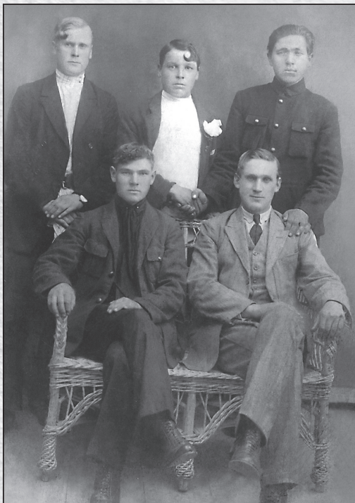
Мужчины-староверы, 30-е годы XX в.