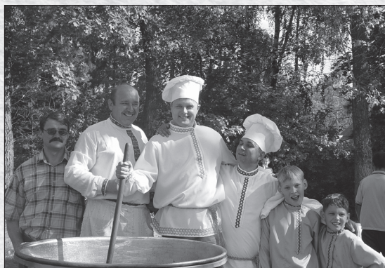
В летнем молодежном лагере.